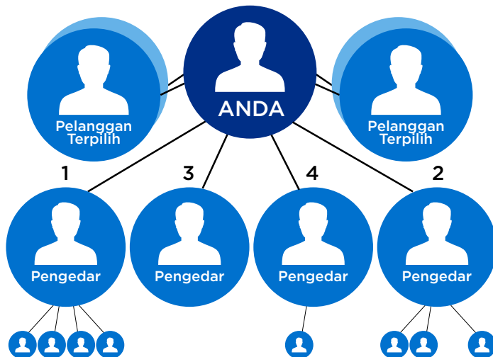
Rajah 1. Pengedar dan Pelanggan Terpilih

Selaku Pengedar USANA, anda boleh menjual produk USANA kepada rakan sahabat anda, mendaftarkan mereka sebagai Pelanggan Terpilih ataupun menaja mereka untuk menyertai organisasi anda sebagai Pengedar (sila rujuk Rajah 1). Di Malaysia, USANA membenarkan seseorang Pengedar mengusahakan empat "kaki" Pengedar semaksimumnya.